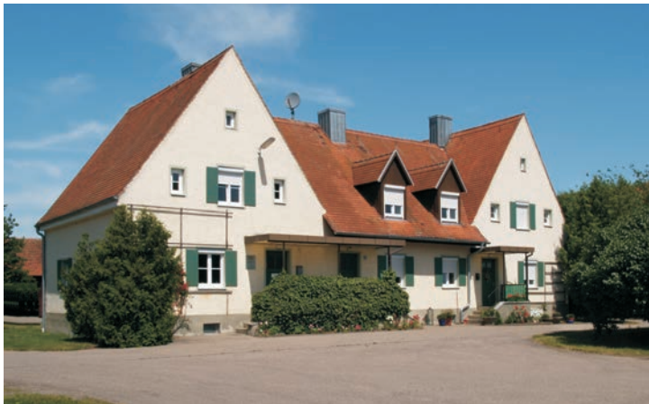
Verwaltungsgebäude des Baumannshofs